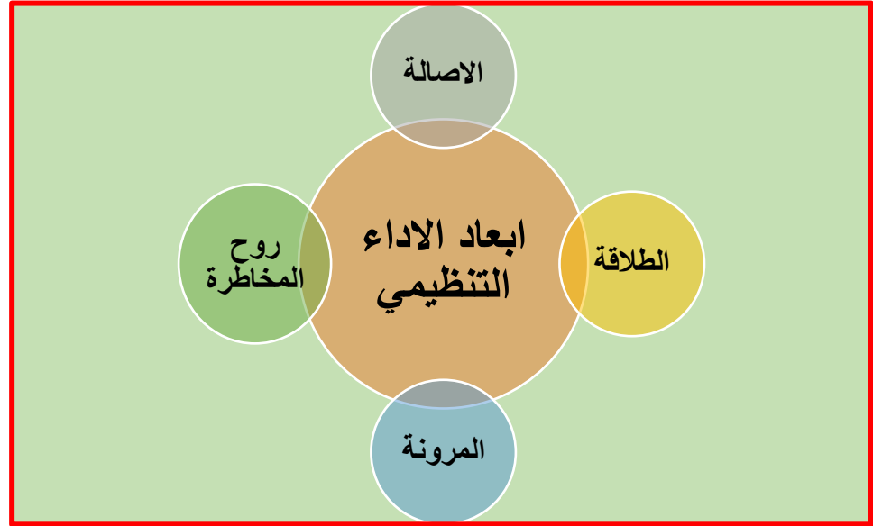
شكل رقم ( ٥ ) يوضح ابعاد الاداء التنظيمي

٤ - روح المخاطرة : وتقيس عمليه قيام الموظف في تعريض نفسه للفشل أو النقد والدفاع عن أفكاره الخاصة كما تعني اخذ زمام المبادرة في تبني الافكار والاساليب الحديثة والبحث عن الحلول لها وفي الوقت نفسه يكون الفرد قابلا لتحمل المخاطر الناتجة عن الاعمال التي يقوم بها ولديه الاستعداد لمواجهة المسؤوليات المترتبة على ذلك ( حسن , ٢٠١٣ : ١٤٢).