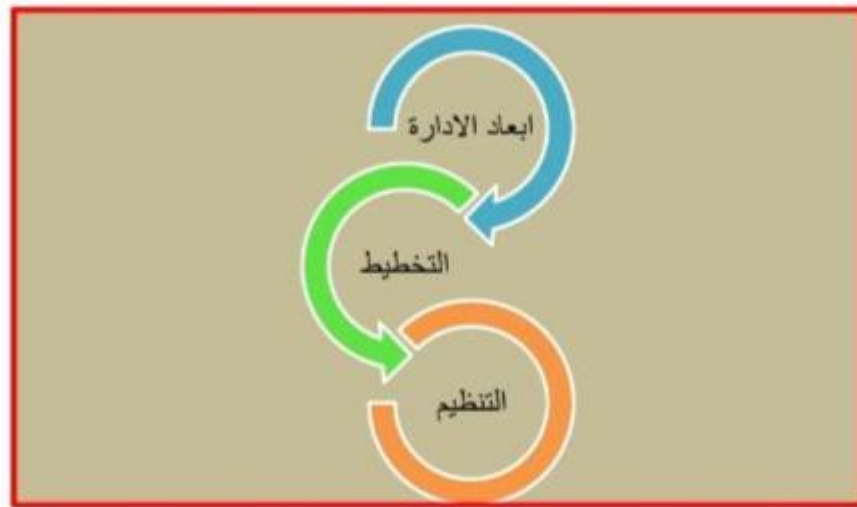
شكل (٢) يوضح أبعاد الإدارة

٢_التنظيم :هو تخصيص الموارد والمهام وإقامة الدوائر والأقسام لإنجاز العمل بشكل فعال ويتضمن التنظيم مجموعة عناصر , تجمع الأنشطة في وحدات تنظيمية، تخصيص العمل، المهام التنفيذية والاستشارية، إعادة جدولة العمل، اعداد الهيكل التنظيمي، تصميم الوظائف, فمن خلال التنظيم يتمكن المدراء من نقل الخطط إلى فعل حقيقي من خلال الأفراد ودعمهم بالموارد والتكنولوجيا اللازمة (ابو قحف، ٢٠١٥ : ٩٠ ).