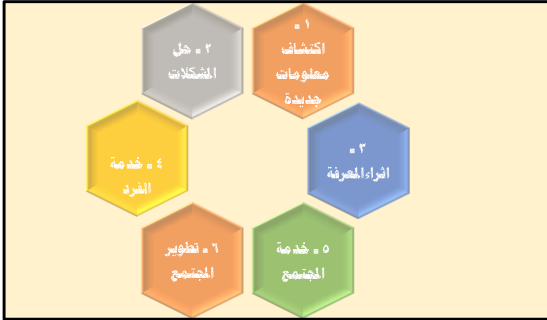
شكل (٢) يوضح المقصود بالبحث التربوي (محمود ، ٢٠٠٦ : ٣٩)